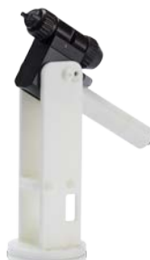
Brazo macizo Colector trasero