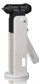
Brazo macizo Colector inferior