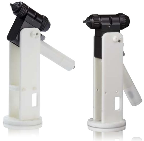
Pistola con colector trasero con soporte robotizado

Los modelos de pistola incluyen el cabezal de aire con referencia 24N477 y la boquilla de 1,5 mm (0,055 in) con referencia 24N616